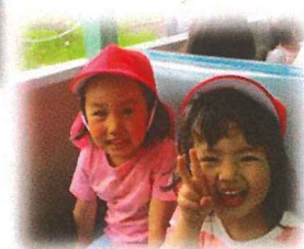
2才以上児親子遠足 IN やながわ希望の森公園