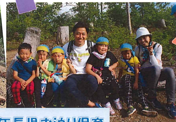
年長児お泊り保育