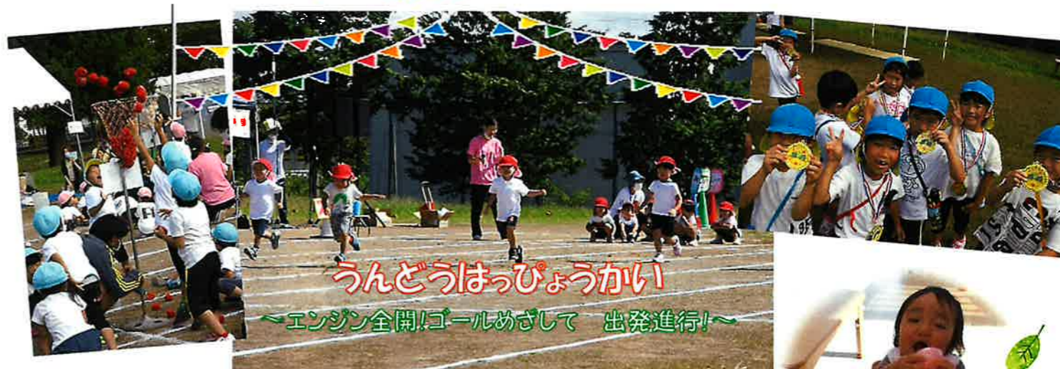
うんどうはっぴょうかい