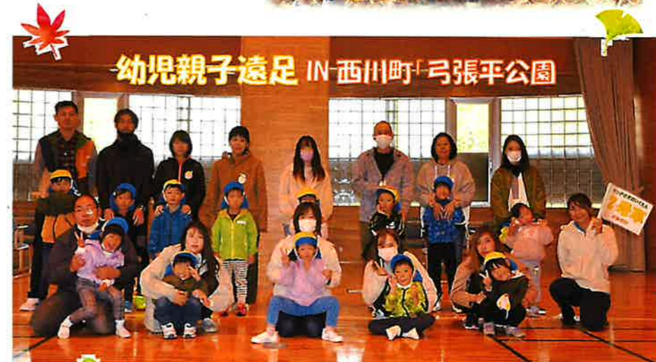
幼児親子遠足 IN 西川町「弓張平公園」