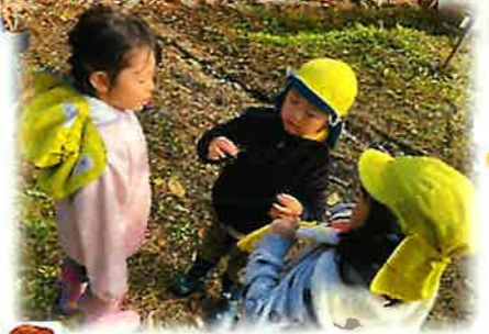
やきいも遠足 IN 飯豊少年自然の家