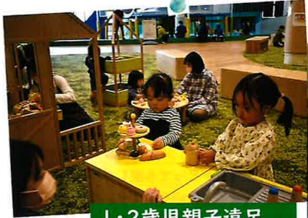
1・2歳児親子遠足 IN 長井市「くるんと」

第114号 2023年11月29日 松ヶ岬保育園 〒992-0059 米沢市西大通1丁目6-56 TEL21-0349/FAX21-0369 E-mail matsuga@smile.ocn.ne.jp http://www.syogokai.jp/matsugasaki/