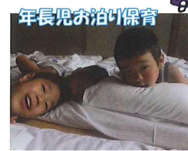
年長児お泊り保育