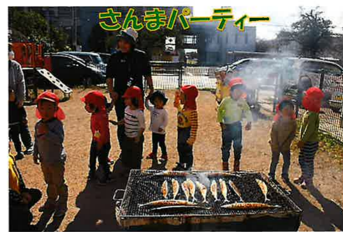
さんまパーティー