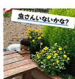
「ぶらんど」第119号 2024/9/26 松ヶ岬保育園