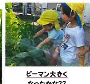
ピーマン大きくなったかな??