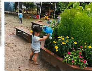
1歳児のお友だちも水やりをしてくれています!