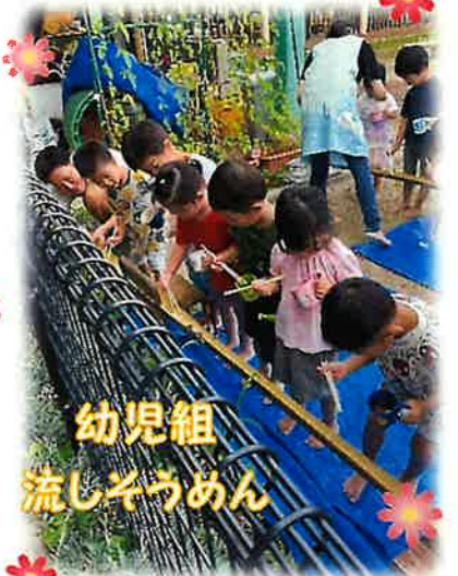
幼児組 流しそうめん